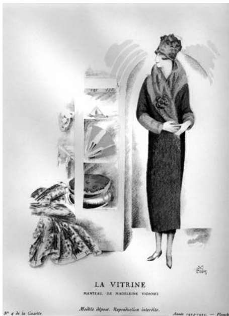
Illustration d'après un modèle créé par Madeleine Vionnet.

Elle essaiera toutes les combinaisons possibles, dérogeant aux règles habituelles du métier. Certains modèles sont réalisés d'une seule pièce. Dans d'autres cas, les patrons forment des figures complexes et il devient difficile d'en identifier les éléments. Vionnet a révolutionné l'usage du biais en l'étendant à l'ensemble du vêtement. Cette pratique permet d'obtenir des « tombés » de tissus incomparables et d'en exploiter l'élasticité pour mouler le corps sans l'entraver. Il est très difficile à maîtriser et nécessite des métrages et des chutes de tissus importants. La maison se faisait d'ailleurs livrer par les « Soyeux » lyonnais des toiles de largeur plus grande que le standard habituel. Le célèbre « dégueulé Vionnet » – ce col révolutionnaire qui dérouta tellement