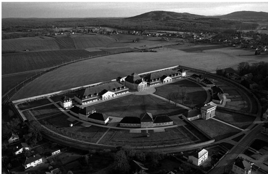
Saline royale d'Arc et Senans, patrimoine mondial de l'Unesco. A l'arrière-plan, la forêt de Chaux.

Les familles travaillant en forêt de Chaux sont essentiellement nomades et se déplacent au gré des coupes de bois. En 1724 par exemple, la forêt est découpée en 20 triages, puis en 16 à partir de 1777. Les gens vivent dans des « baraques » formant de véritables hameaux forestiers implantés à peu près au centre du triage. Les naissances, mariages et décès sont déclarés dans la paroisse la plus proche parmi les villages environnant la forêt, ce qui rend très difficile les recherches généalogiques.