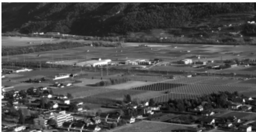
La plaine du Rhône contemporaine, à la hauteur d'Ardon.

L'histoire du Rhône, de sa plaine riveraine et de ses habitants est donc à écrire ! Voilà un défi important qui nécessitera de longues années d'études, un chantier conséquent mais bien plus discret, bien moins bruyant que celui de la troisième correction qui débute dans notre canton. ❁